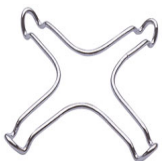
GRM Подставка для кофе, для газовых варочных панелей