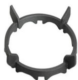
WOKGHU Чугунное кольцо WOK